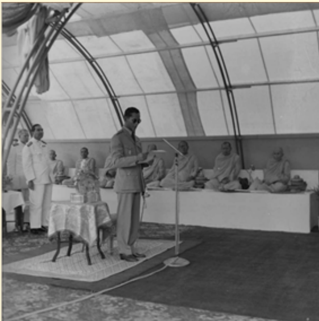
พระบาทสมเด็จพระปรมินทรมหาภูมิพลอดุลยเดช (พระอิสริยยศในขณะนั้น) เสด็จฯ ประทับภายในพลับพลาพิธีและทรงมีพระราชดำรัสในพิธีเปิดถนนมิตรภาพ เมื่อวันที่ ๑๐ กรกฎาคม พ.ศ. ๒๕๐๑

เดิมทีถนนมิตรภาพเป็นถนนแบบ 2 ช่องทางจราจร แต่ปัจจุบันเป็นถนน 2-10 ช่องทางจราจร มีการขยายถนนเป็นถนนแบบ 4 ช่องทางจราจร เมื่อสมัยรัฐบาล พลเอกชาติชาย ชุณหะวัณ เป็นนายกรัฐมนตรี