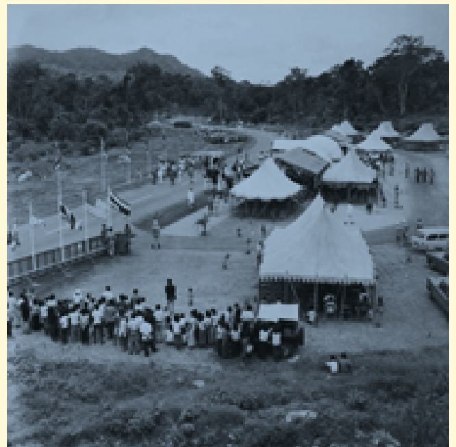
พลับพลาพิธีในคราวพระบาทสมเด็จพระปรมินทรมหาภูมิพลอดุลยเดช (พระอิสริยยศในขณะนั้น) เสด็จพระราชดำเนินมาทรงประกอบพิธีเปิดถนนมิตรภาพบริเวณกิโลเมตรที่ ๓๓ อำเภอมวกเหล็ก จังหวัดสระบุรี เมื่อวันที่ ๑๐ กรกฎาคม พ.ศ. ๒๕๐๑